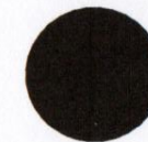
ca. 11 cm